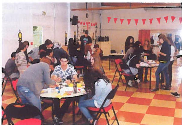
Atelier "triftyques" à Les temps d'art

Dernier jour à Strasbourg, l'occasion de pénétrer un lieu mythique par son histoire et son symbole : Le Conseil de l'Europe.