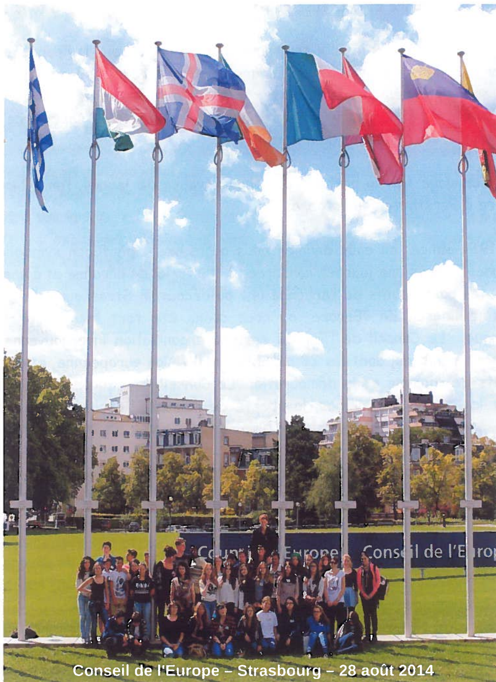
Conseil de l'Europe - Strasbourg - 28 août 2014