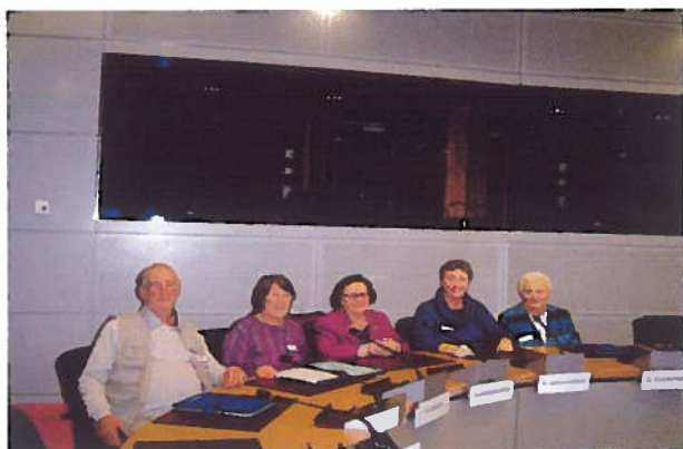
Les participants Nogentais