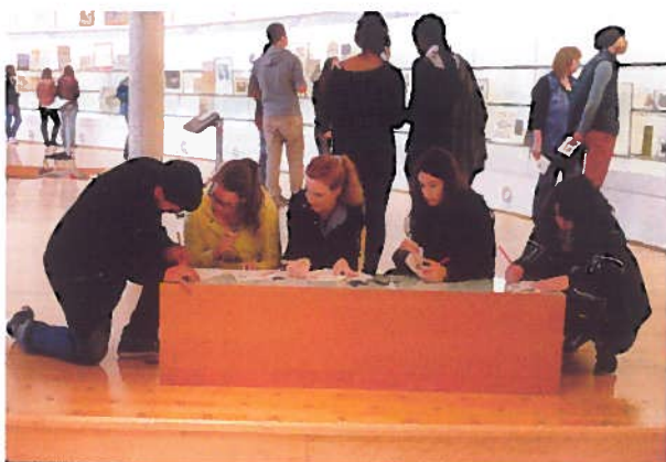
A l'Historial de la Grande Guerre à Péronne

2 ème journée strasbourgeoise, en route vers Europa-Park ! Reconnu comme le plus grand parc sur le thème de l'Europe, ce parc d'attraction pas comme les autres, se compose de quartiers inspirés par différents pays européens. Nos jeunes purent découvrir et apprécier les différentes attractions tout au long de la journée.